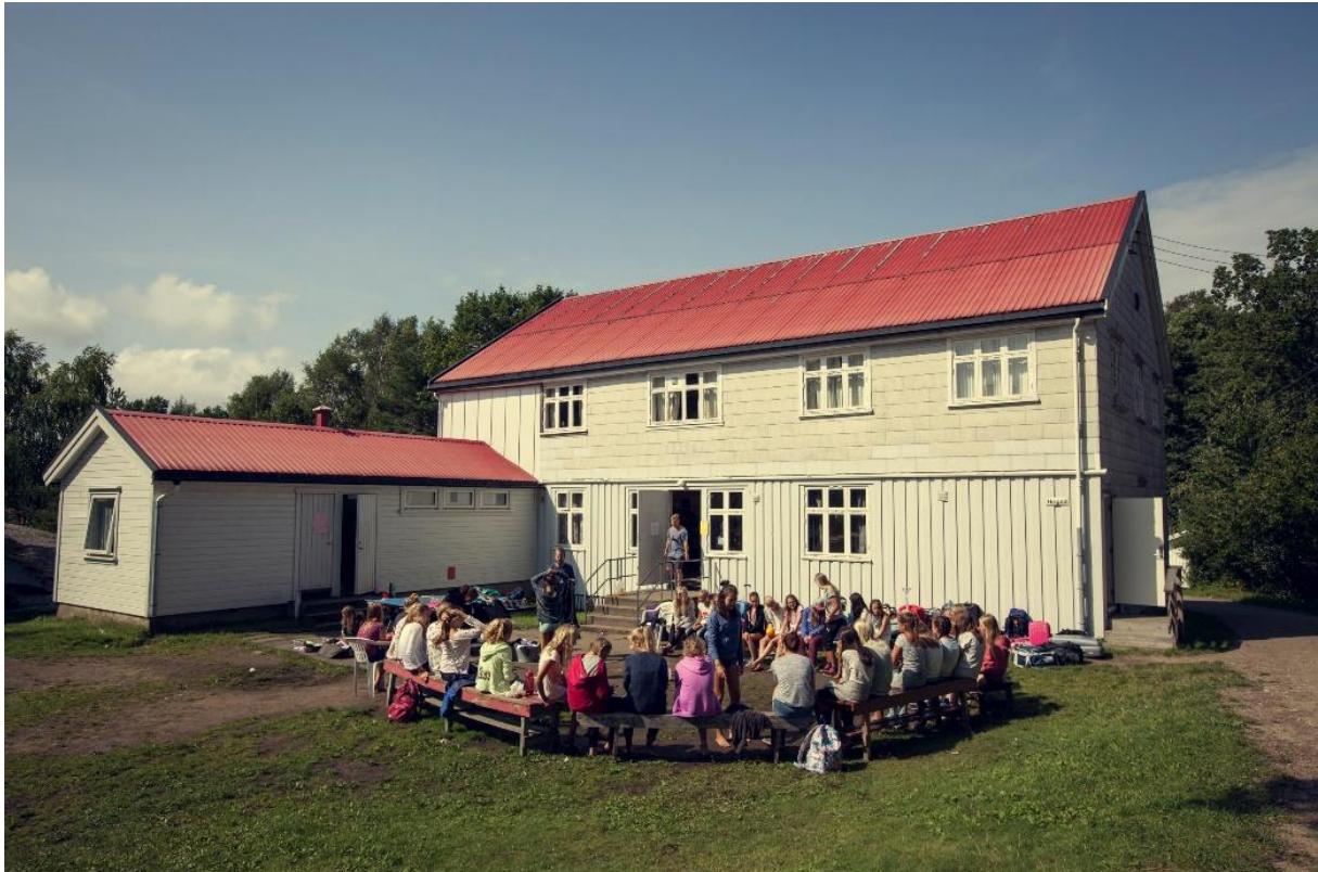
Her er Høgda, en av de 11 koloniene på Hudøy. Kolonien er liksom hjemmet ditt mens du er på øya.

På hjemmesiden til Hudøy kan du se en film som viser reisen fra Sognsvann (der bussene starter) og helt til Hudøy. Hjemmesiden vår finner du på www.hudoy.no .