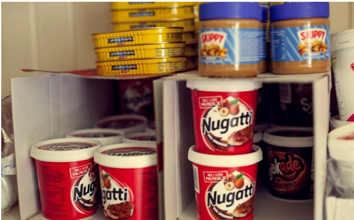
Det er masse annet godt pålegg på Hudøy også altså, ikke bare Nugatti!

Du smører matpakke og pakker sekken din selv hver dag. Hvis du ikke har gjort dette før er det bare å spørre om hjelp. De voksne er skikkelig gode til å lære deg de beste triksene. Hvis du for eksempel ikke har prøvd å blande Nugatti og peanøttsmør før, er det absolutt verdt å prøve.